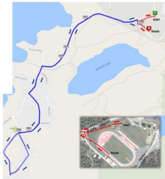
5km course map