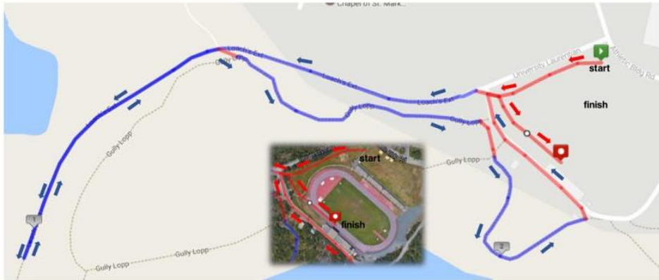
2.5km course map